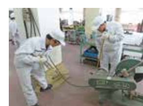
実習室はいつもきれいに!