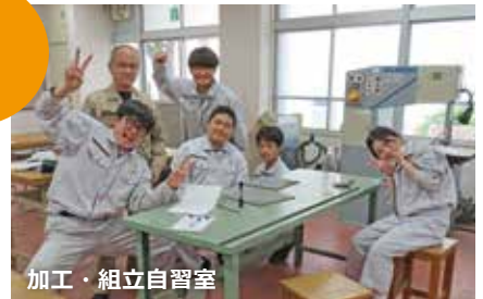
加工・組立自習室